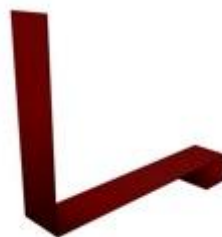
Планка примыкания нижняя к трубе