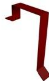
Планка торцевая 60x97