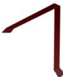
Планка конька односкатной кровли 160x160