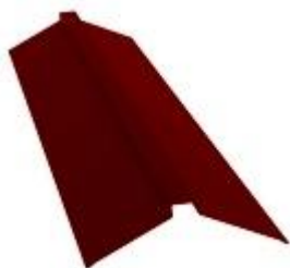
Планка конька плоского 150x40x150