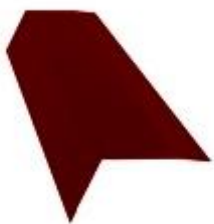
Планка капельник 100x65