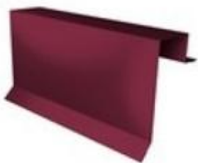
Планка фронтонная 95x45x28x20