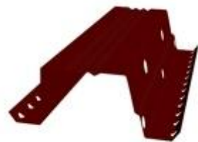
Вентилируемый прогон опорный