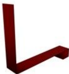
Планка примыкания нижняя к трубе