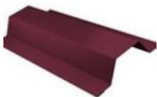
Планка опорная 50x35x50