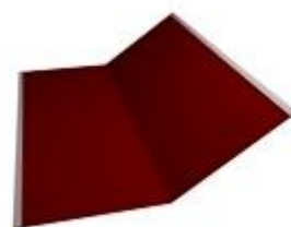
Планка ендовы нижней 300x300