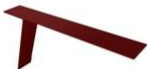
Планка карнизная 130x80