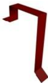
Планка торцевая 60x97