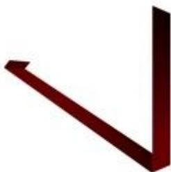
Планка примыкания верхняя к трубе