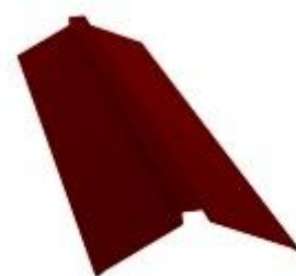
Планка конька плоского 150x40x150