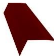
Планка капельник 100x65