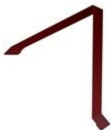
Планка конька односкатной кровли 160x160