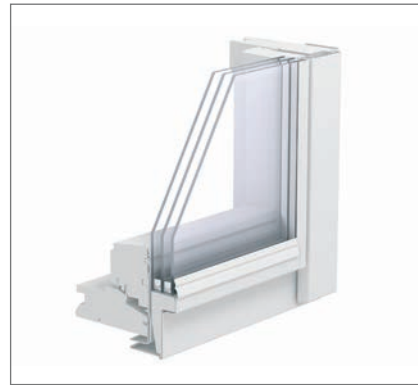
Окно модели GGL 3065 (3D модель)

Для обеспечения лучшего обзора рекомендуется установка в комбинации с