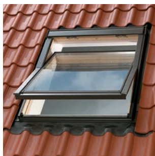
4 окна GGL M08