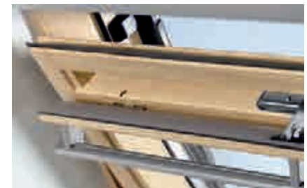
Вентиляционный клапан-форточка модели GGL.

Необходимо утеплить откосы и зазор между оконной коробкой и конструкциями кровли.